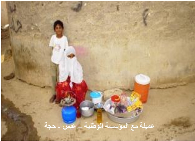
عملية مع المؤسسة الوطنية - عبس - حجة

تتويجاً للنجاحات التي حققها بنك الأمل للتمويل الأصغر، تم تتويجه بجائزة MIX الفضية في الأداء الاجتماعي لعام 2011، حيث تم اختياره للفوز بهذه الجائزة وفقاً للمعايير الدولية في الأداء الاجتماعي الذي يحمل رسالة اجتماعية تكمن في تقديم خدمات مالية وغير مالية للفئات الأكثر فقراً في المجتمع من ذوي الدخل المحدود والمنخفض وأصحاب المشاريع الصغيرة والأصغر، والتركيز على شريحتي الشباب والمرأة لغرض تحسين ظروفهم المعيشية، ومساعدتهم على الخروج من الفقر. كما يساهم البنك على المستوى الإقليمي في تأسيس أول مؤسسة تمويل أصغر في الصومال من خلال تقديم الدعم الفني (المرحلة الأولى) لمنظمة "العون يُنعش الأمل" (Help leads to hope)، وقد تم إطلاع مدير المنظمة الذي زار بنك الأمل على تجربة البنك من خلال البرنامج الذي أعده للمؤسسات الناشئة في مجال التمويل الأصغر.