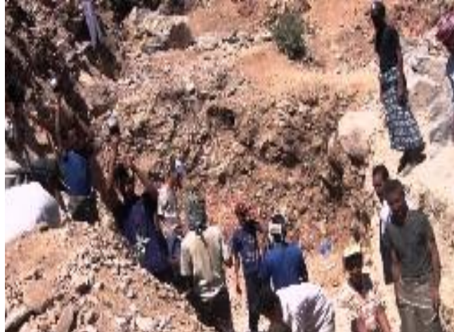
مشروع النقد مقابل العمل- الأعجول- القبيبة- لحج

تمت الموافقة على 25 مشروعاً (موزعة على القطاعات الفرعية: تدخل متنوع، دراسات أولية، حماية واستصلاح أراض) بكلفة إجمالية تُقدر بحوالي 3.4 مليون دولار، كما يبلغ عدد الأسر المستفيدة منها 114 أسرة (18,341 شخصاً)، وعدد فرص العمل المؤقتة المتولدة منها أكثر من 292 ألف يوم عمل (منها 23,340 مخصصة للإناث)