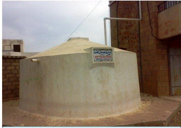
خزان فرومنت لتجميع مياه الأمطار بقرية عفاقة- صبرا الموادم - تعز

الرابعة و30% في الفئة الثالثة. وتحتوي المشاريع على 54 خزاناً لحصاد مياه الأمطار بسعة إجمالية 80,000 م 3 ، وستة عشر كرفياً بسعة إجمالية 58,000 م 3 ، و9,407 سقايات خاصة بسعة إجمالية 465,900 م 3 ، وأنابيب بطول إجمالي 15,400 متر لتقريب الخدمة. وقد بدأ العمل الفعلي في 88 مشروعاً.