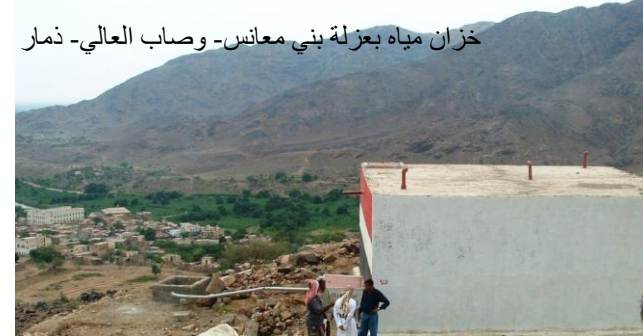
خزان مياه بعزلة بني معانس- وصاب العالي- ذمار

ويتواصل تنفيذ 4 مشاريع سقايات خاصة (عزلة القحيفة، جبل حبشي، تعز)، ومشروع مماثل في عدة قرى في عزلة وادعة. كما تتم متابعة تنفيذ مشروع تحسين وشق طريق المحلة - الميرك - الرضم - الصراف (بني معانس)، ومشروع تأهيل وتحسين طريق عرزمة - عمق (الأثلوث)، ومشروع السقايات الخاصة لقرى واعي وموركة وهياج العلب (الأثلوث). وكذا مشروعات إنشاء برك مغطاة في قرية بارق ووادي الاحلاء (عزلة بني علي، ملحان، المحويت).