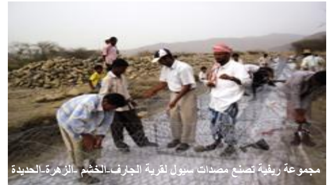
مجموعة ريفية تصنع مصدات سيول لقرية الجارف-الحشم-الزهرة-الحديدة

وتفدّت أيضاً أنشطة بناء قدرات 17 مجموعة في تربية النحل، ولفترة أسبوعين، في مديرتي المنصورية واللحية (الحديدة). وتُرَب 19 استشارياً في تكوين 7 مجموعات إنتاجية (بين المجتمعات) في همدان وأرحب (صنعاء). وتم كذلك تدريب 48 عضواً من لجان المنتجين الريفيين في مديرية المضاربة وراس العارة (بمحافظة لحج)، والاستعانة بأحد عشر استشارياً لتنفيذ متابعات وإعداد دراسات وبناء قدرات المجموعات في طور الباحة والمقاطرة والقيبية (لحج). وتم كذلك بناء قدرات وتأهيل 65 مرشداً وأخصائياً زراعياً في محافظة مأرب في تخطيط وتقييم البرامج الإرشادية الزراعية.