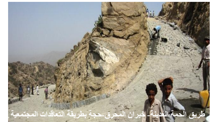
طريق الحمة العذبة- خيران المحرق-حجة بطريقة التعاقدات المجتمعية

فيما يخص المتابعة الميدانية لمشاريع القطاع، فقد تمت - خلال الربع - زيارة 41 مشروعاً مؤرّعة بين مشاريع قيد التنفيذ (للاطلاع على مستوى الجودة في الأعمال المنفذة) ومشاريع من خطه 2012 (للاطلاع على جودة الاستهداف، ومدى مطابقة المشاريع للمعايير المحددة للاستهداف). وبذلك يكون العدد الإجمالي التراكمي للمشاريع التي تمت زيارتها 225 مشروعاً.