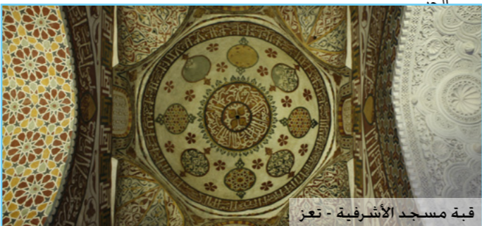
قبة مسجد الأشرفية - تعز