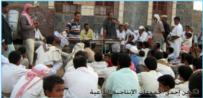
تكوين إحدى المجموعات الإنتاجية الزراعية

تناولت العديد من المجالات والموضوعات تناولت 2 منها مجالي البيطرة وزراعة وإنتاج الزيتون في كل من إب وصنعاء على التوالي، شارك فيها ما يزيد عن 60 مزارعاً ومزارعة ومرشداً زراعياً، في حين تناولت 4 منها دورات تدريبية لاستشاريي الفروع في مجالات تكوين المجموعات الإنتاجية وبناء قدراتها في كل من حجة والحديدة وصنعاء وعدن، شارك فيها 150 استشارياً واستشارية وتم الاستعانة بهم في تنفيذ أنشطة المكون الثالث من الزراعة المطرية. كما انتهى القطاع خلال شهر يونيو من تنفيذ دورتي تدريب في مجال إعداد وتنفيذ حملات التوعية الإرشادية شارك فيها 60 مشاركاً ومشاركة للاستعانة بهم في تنفيذ 5 حملات توعية إرشادية في 10 مديريات من 5 محافظات يعمل فيها مشروع الزراعة المطرية.