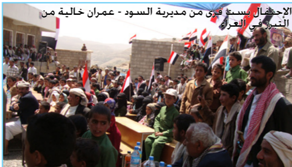
الإحضان بسبغ قرى من مديرية السود - عمران خالبة من التنوير في العراء

بجامعة صنعاء، وتأهل من المتدربين 60 متدرباً ومتدربة. ومن الأنشطة التي نفذت في إطار منهج الصرف الصحي التام بقيادة المجتمع والتي تجسد أثر المنهج في تغيير السلوك تم في 29/5/2010م إعلان ست قرى في مديرية السود كقرى نموذجية في الصرف الصحي والقرى هي بيت حازب، مقنع، بيت الولي، بيت الراحي، بيت العنص وبيت المؤيد. وحضر الحفل الإخوة وكيل محافظة عمران لقطاع البيئة والأخ رئيس وحدة المياه والبيئة بالصندوق الاجتماعي ومدير فرع الصندوق بعمران وعضو مجلس النواب وأعضاء السلطة المحلية الممثلين لمديرية السود وأيضاً في 7/6 / 2010 م تم البدء بتنفيذ المرحلة التجريبية لحملات التوعية بمنهجية الصرف الصحي الكامل بقيادة المجتمع بواسطة أهالي القرى التي أعلنت نموذجية في الصرف الصحي في كل من محافظات تعز واب وعمران وبمعدل عشر قرى في كل محافظة. وكذلك خلال الفترة من 30/6-26 تم في فرع الصندوق بتعز تنفيذ دورة تدريبية على تنفيذ منهج الصرف الصحي الكامل بقيادة المجتمع، حيث تم تدريب 32 استشاري (12 اناث و20 ذكور) بالإضافة إلى خمسة ضباط مشاريع.