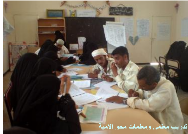
تدريب معلم، ومعلمات محو الأمية

كما نُفذت دورة تدريبية، خلال الفترة 24-29 يوليو 2010، حول "التخطيط الاستراتيجي وإعداد الخطط التنفيذية" لمدراء عموم محو الأمية وتعليم الكبار في الجهاز ومكاتبه في 22 محافظة. حضر الدورة 30 مشاركاً ومشاركة من عموم محافظات الجمهورية.