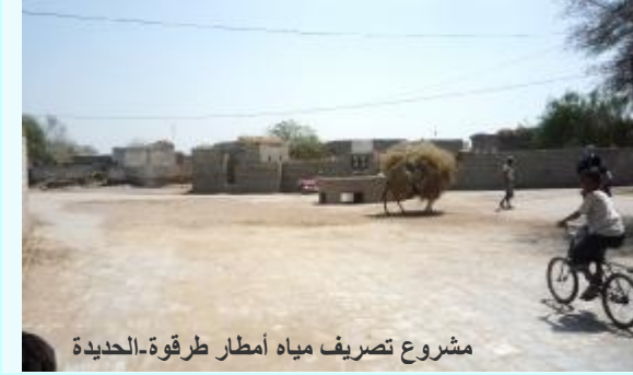
مشروع تصريف مياه أمطار طرقة-الحديدة