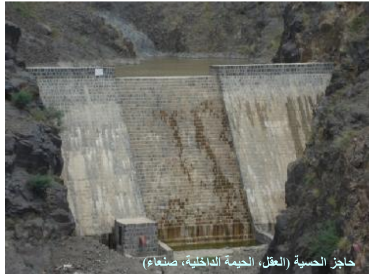
حاجز الحسبية (العقل، الحيمة الداخلية، صنعاء)

وقامت الوحدة بزيارة مشاريع برفقة الضباط المختصين في الفروع بهدف متابعة المشاريع، وتسريع انجازها.. وتم خلال الزيارة عقد ورشسيّ عمل في فرعيّ عدن وتعز، استهدفتا الاستشاريين المشرفين على مشاريع السقايات الخاصة في الفرعين بهدف تبادل الخبرات، وحل أية معوقات.