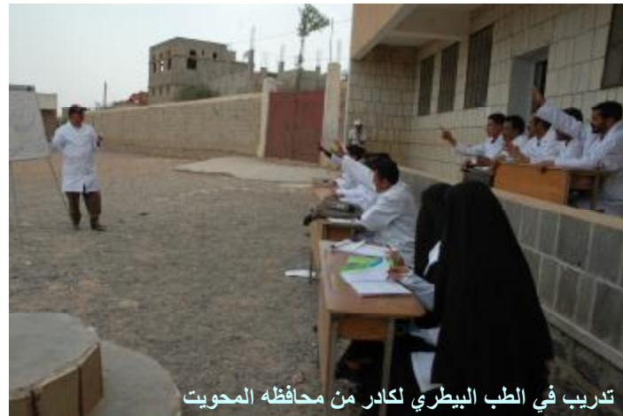
تدريب في الطب البيطري لكادر من محافظه المحويت

في إطار بناء قدرات المزارعين والمرشدين الزراعيين، تم تنفيذ دورتين تدريبيتين في محافظتي إب والمحويت: اهتمت الأولى بإكساب المزارعين والمرشدين المعارف والمهارات الحديثة في مجال البيطرة، فيما اقتصت الثانية بتعليمهم أسس ومهارات زراعة وإنتاج المانجو. استمرت فترة التدريب في كل منهما 6 أيام، وشارك فيهما 60 مزارعاً ومرشداً زراعياً من المحافظتين.