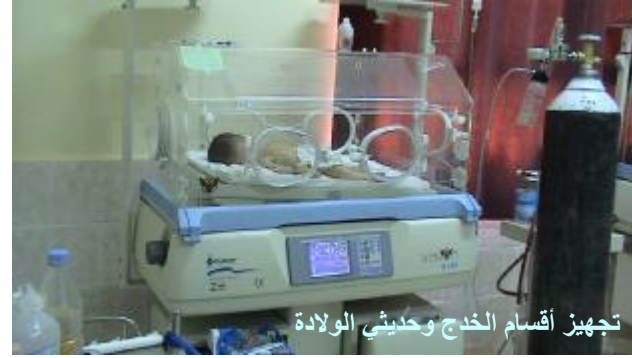
تجهيز أقسام الخدج وحديثي الولادة

صُمم هذا المكون لتوسيع وتحسين خدمات الصحة الإنجابية من خلال بناء وتجهيز أقسام الطوارئ التوليدية الأساسية والشاملة، ومراكز الأمومة والطفولة، وتجهيز أقسام الخدج وحديثي الولادة.